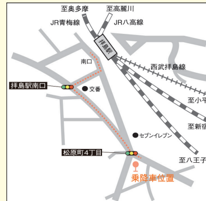
拝島バス乗降位置 (JR拝島駅徒歩3分)

行き（学園着）は右記乗車位置より 帰り（学園発）は右記降車位置①（八王子駅利用者） にて降車後、降車位置②（京王八王子駅利用者） にて降車となります。