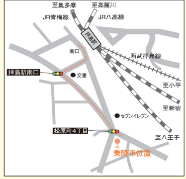
拝島バス乗降位置 (JR 拝島駅徒歩3分)

行き(学園着)は右記乗車位置より 帰り(学園発)は右記降車位置①(八王子駅利用者)にて降車後、降車位置②(京王八王子駅利用者)にて降車となります。